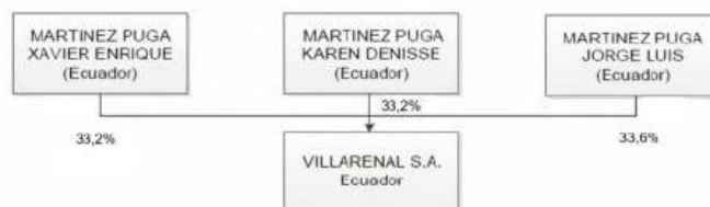
Gráfico 1. Estructura societaria ex ante de VILLARENAL